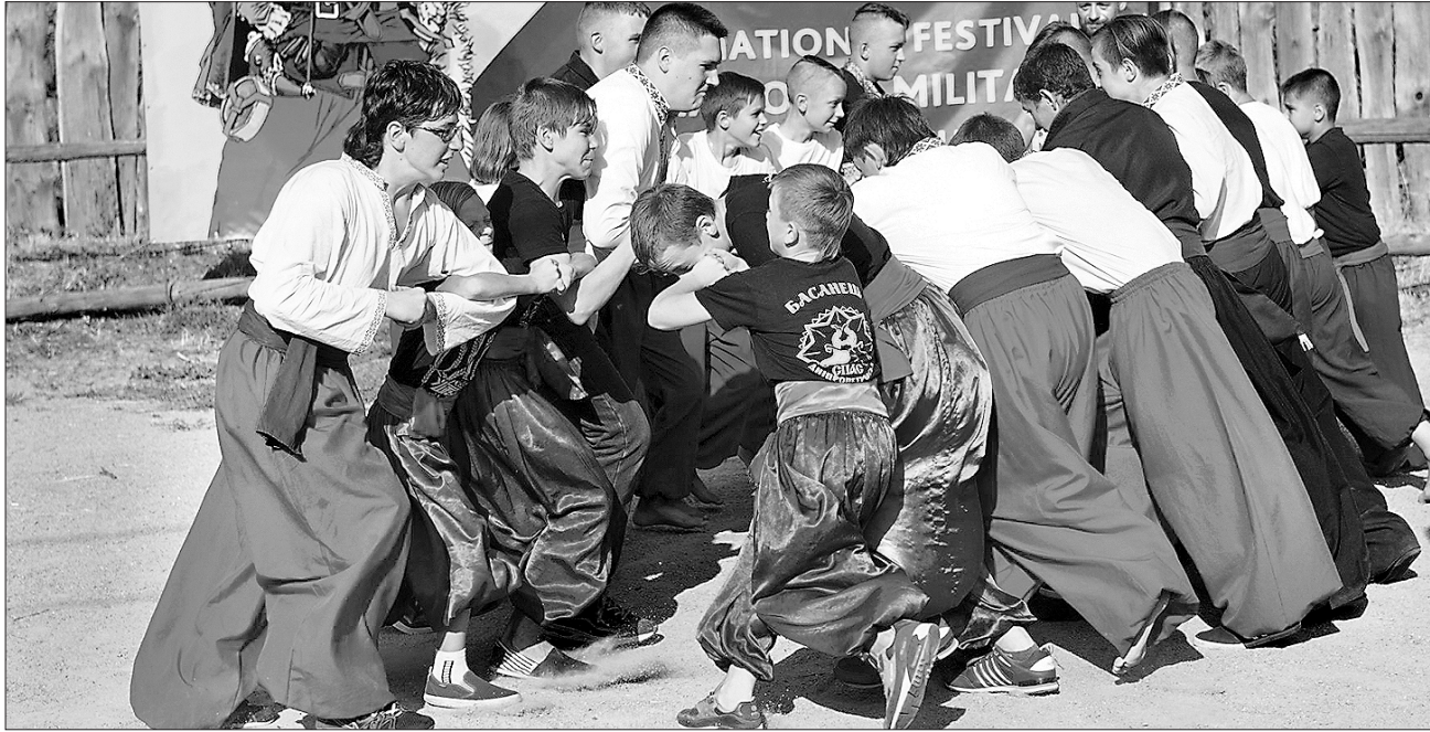
Бойове мистецтво «Спас» приваблює дедалі більше молоді