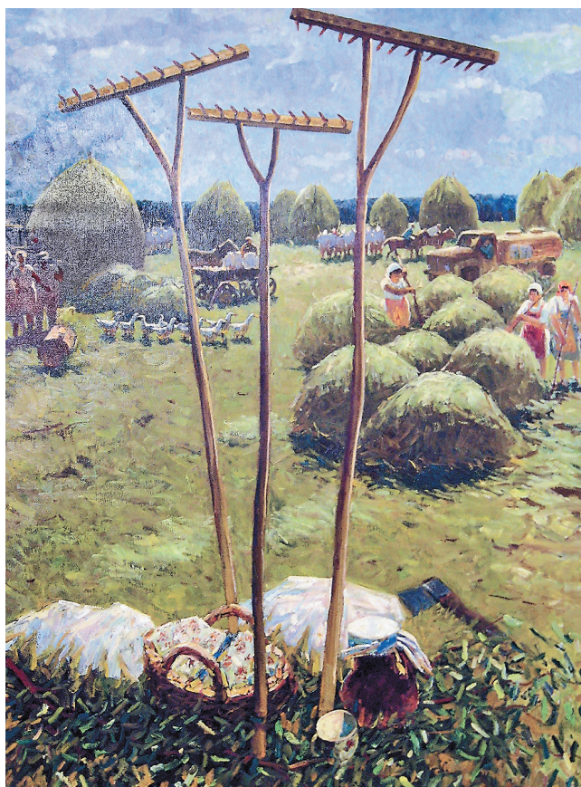
Косовиця поблизу Десни в зображенні Віктора Кавуна більше схожа на свято, ніж на нелегку працю