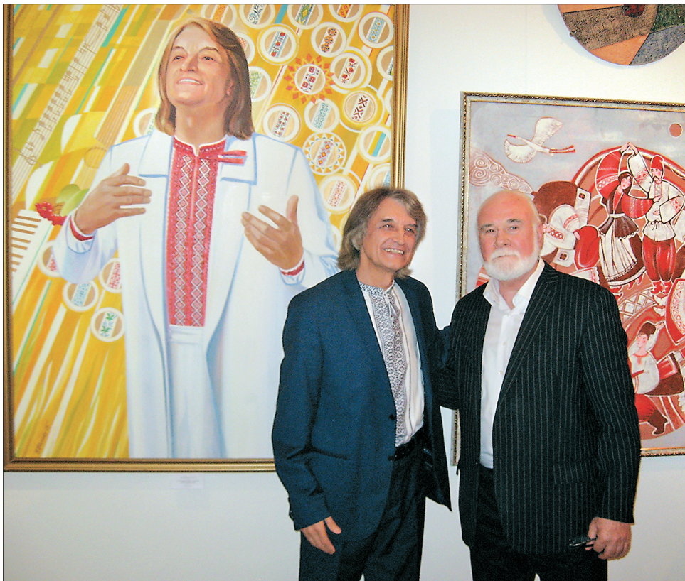
На тлі портрета Павла Дворського художник Василь Босенко закодував символи творчості митця, завдяки яким нащадки зрозуміють, що йдеться про співака і композитора

Він звернув увагу на той факт, що до Дня незалежності зали, де розмістили експозицію, відремонтовано. І подякував киянам, які надали більшість творів, представлених на виставці, а також Харківській, Одеській, Закарпатській обласним організаціям спілки, які так прискпіливо й конструктивно поставилися до відбору творів, що ті одразу зайняли почесне місце в