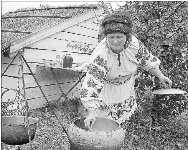
Наварю борщику в обмащеному глиною горщику