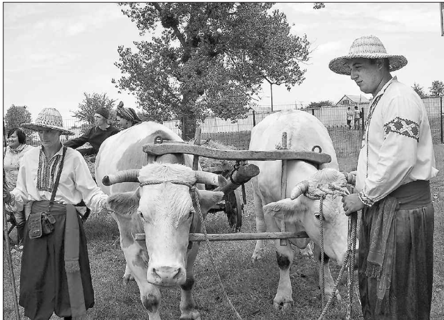
Незмінні учасники Сорочинських ярмарків — воли Гайок та Соловейко і цього разу радують люд