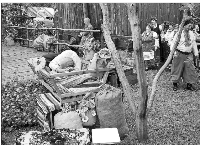
«Поки там виступають, я подрімаю»