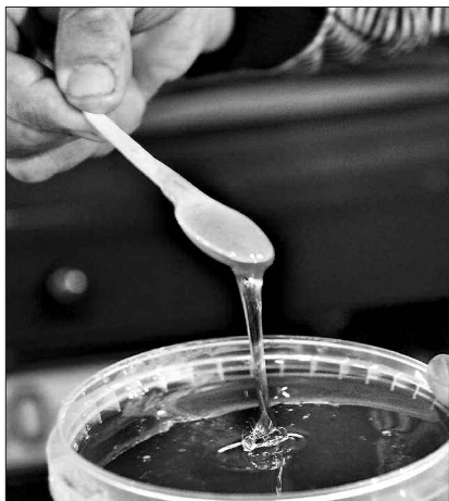
Українці у серпні зазвичай качають бджолиний нектар і запасуються ним на зиму