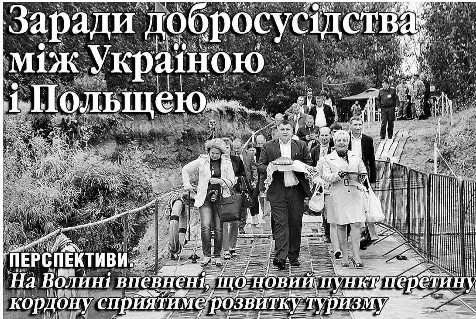
ПЕРСПЕКТИВИ. На Волині впевнені, що новий пункт перетину кордону сприятиме розвитку туризму

На урочистості запросили і високоповажних гостей: народних депутатів, керівництво Волинської облдержадміністрації та Волинської обласної ради, очільників Шацького району та інших. З боку Польщі у святкуванні взяла участь керівники Влодавського повіту та Люблінського воєводства. Для ор-