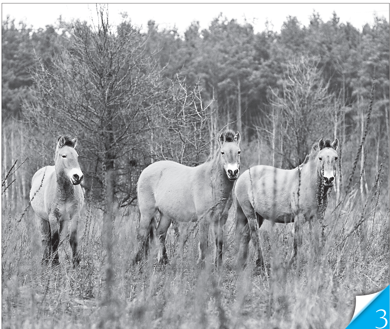
Відтепер на території, що зазнала радіоактивного забруднення внаслідок Чорнобильської катастрофи, дозволено створення об'єктів природно-заповідного фонду

ОРІЄНТИРИ. Мінприроди визначило десяток пріоритетів, а до контролю за їх виконанням варто долучитися громадськості