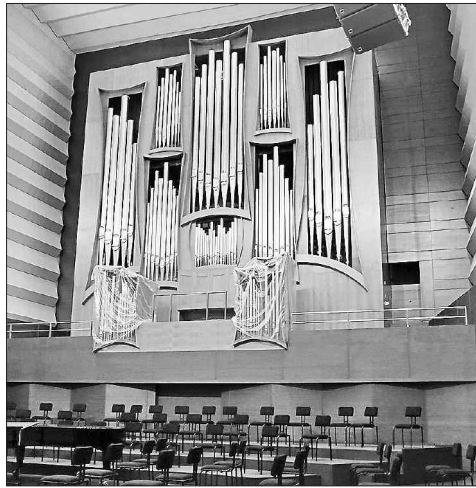
Органна зала ХОФ готова прийняти перших гостей

Сам орган, на монтаж якого знадобилося півтора місяця, харків'яни, за словами диригента, почують у листопаді. «5 вересня очікуємо на приїзд команди німецьких фахівців, які інтонуватимуть орган», — розповів Юрій Янко.