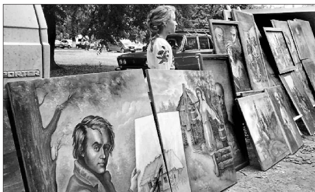
Шевченко надихає художників на переосмислення його образу