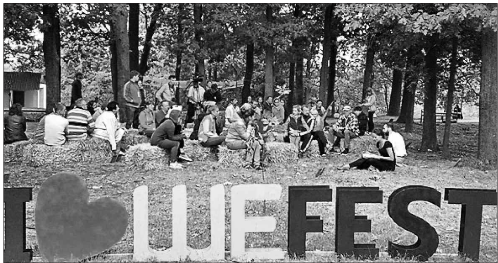
Ось у такій невимушеній обстановці учасники фесту проводили заходи

Ще одна особливість фестивалю — його благодійне спрямування. Усі зібрані кошти підуть на допомогу українським військовим, які обстоюють незалежність нашої держави.