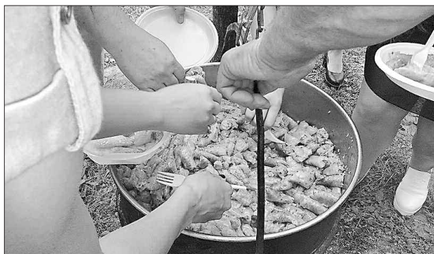
Бичківські жителі вкотре дивували різноманітністю голубців