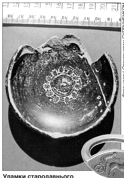
Уламки стародавнього посуду трапляються на городищі мало не на кожному кроці, а ось грецький перстень-печатка унікальний

За його словами, здійснити таке відкриття пощастило науковцям Музею археології та етнографії Слобідської України при Харківському національному університеті імені В. Н. Каразіна спільно з експедицією заповідника «Більськ». Серед знайдених речей, які датують VII століттям до нової ери, — багато місцевої ліпної кераміки, зокрема вцілілі миски, кухоль, а також уламки різноманітного посуду. З інших знахідок — бронзове вістря стріли пелопоннеського типу з шипом.