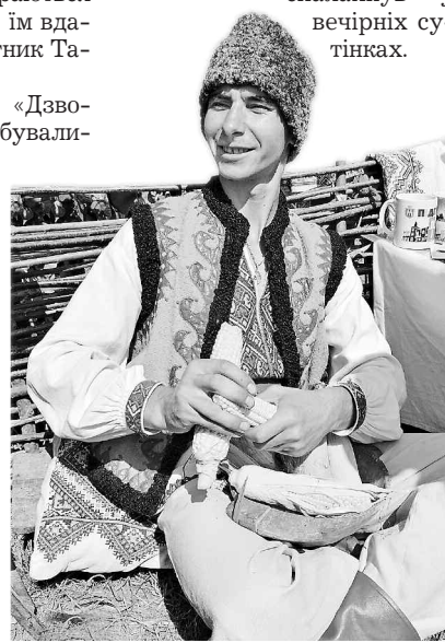
Удома не встиг кукурудзу потербити — хіба це лихо? Тут упоруюся

Та найголовніше і найскоролюбніше дійство фестивалю — запалення лемківської ватри. Цього серпня її вогонь спалахнув у вечірніх сутінках.