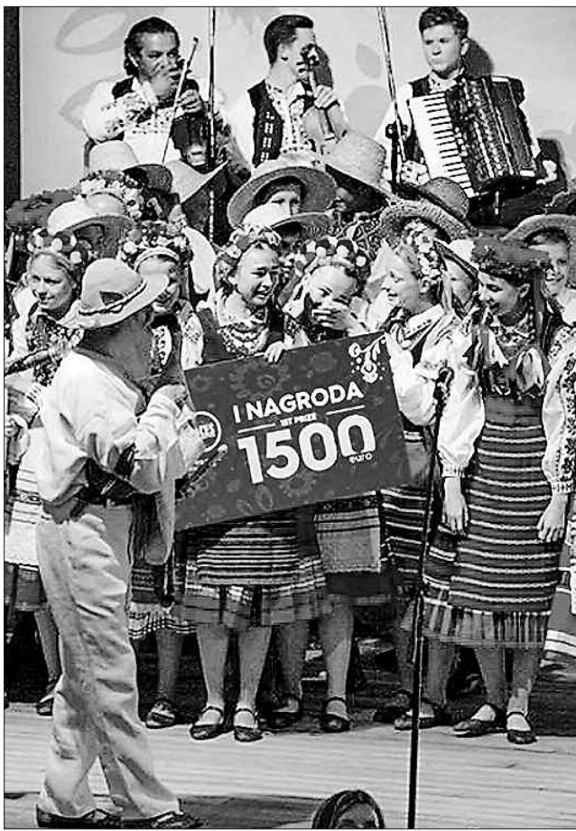
Заслужена нагорода 1500 євро

конструювали із старовинних строїв. Також члени журі відзначили професіоналізм музикантів, використання в оркестрі інструментів, притаманних Україні. У результаті — перше місце та 1500 євро призових! Друге місце та 1000 євро — у колективу з Чорногорії, третє місце та премію в розмірі 500 євро присудили гурту зі Словаччини.