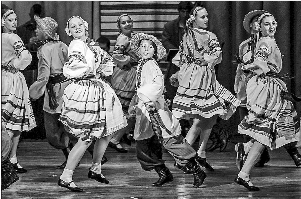
Запальними народними танцями волинські діти підкорили міжнародне журі

За словами експертів, волинянам добре вдалося поєднати фольклорний спів з обробленою хореографією, а костюми дітей вразили різноманітністю та правдивістю. І це не дивно, бо їх ре-