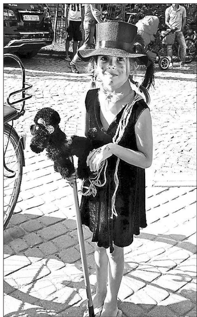
Учасники костюмованого параді із задоволенням і самі веселилися, і гостей розважали

Цікаво, що батьківщиною сажотрусів вважається Дания, бо саме там їх вперше було визнано важливими особами, а впорядкування димарів і камінів набуло державного значення. Сталося це після великої пожежі 1728 року у Копенгагені, яка знищила майже половину міста.