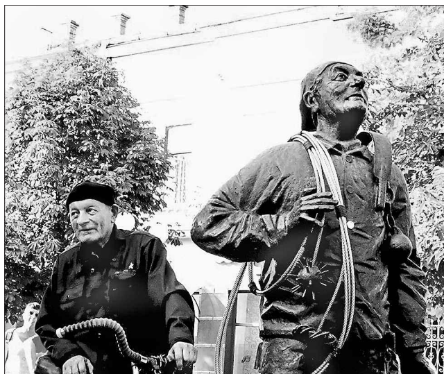
На удачу треба сфотографуватися між двома Берті-бачі — людиною і пам'ятником

Берталона Товта часто можна зустріти в центрі міста, адже саме тут містяться більшість будинків, які потребують його уваги. Цього року в його день на-