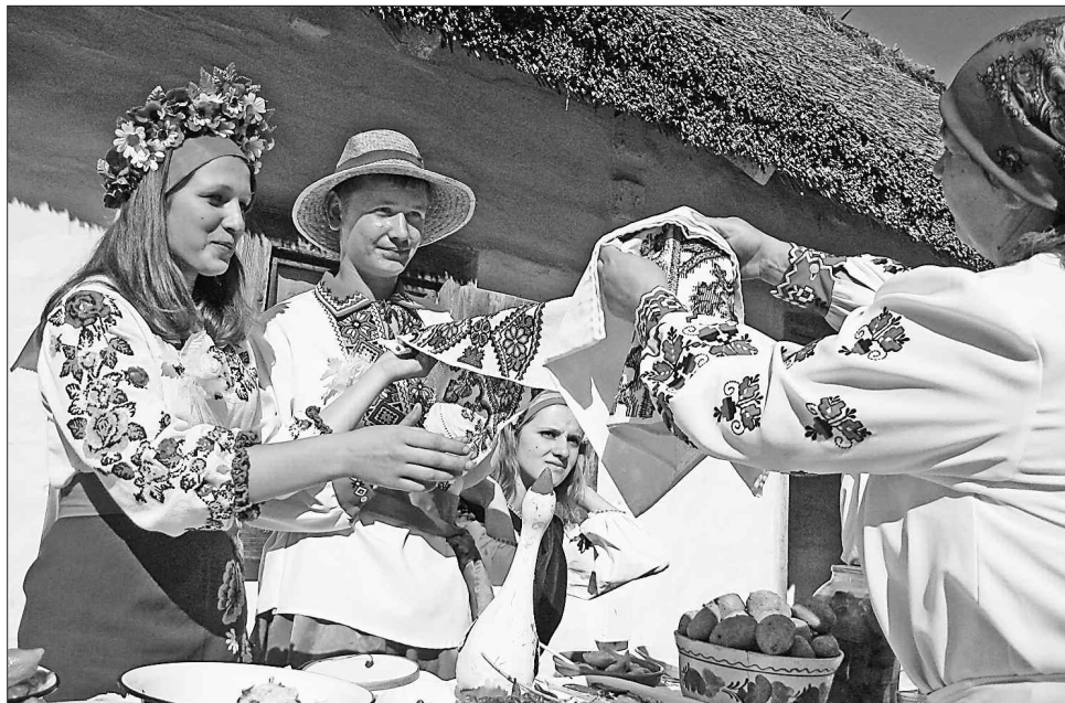
Серпень — місяць врожайний, тож закономірно, що розпочинається сезон гучних весілля

На Маковія у церквах парафіяни освячують запашні букети з трав, з-поміж яких обов'язково мали бути голівки маку. Маковійські букети зберігають біля образів упродовж року. З нагідок, чебрецю, м'яти готують цілющу чай, купелі для немовлят, настоями ополіскують голову — щоб не боліла і не випадало волосся. Взимку мак використовували для куті на Різдва, а на Благові-