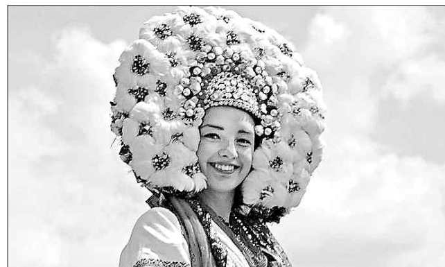
Дивовижної краси віночки прикрашали коломиїських дівчат

Приємним дарунком для гостей фестивалю були виступи Наталі Фаліон і гурту «Лісапетний батальйон», народних артистів України Оксани Савчук та Івана Кавацока (дуєт «Писанка»), Богдана Сташківа, заслужених артистів України Алли Кобиланської, Михайла Попелюка, Миколи Савчука та гурту «Дзвони».