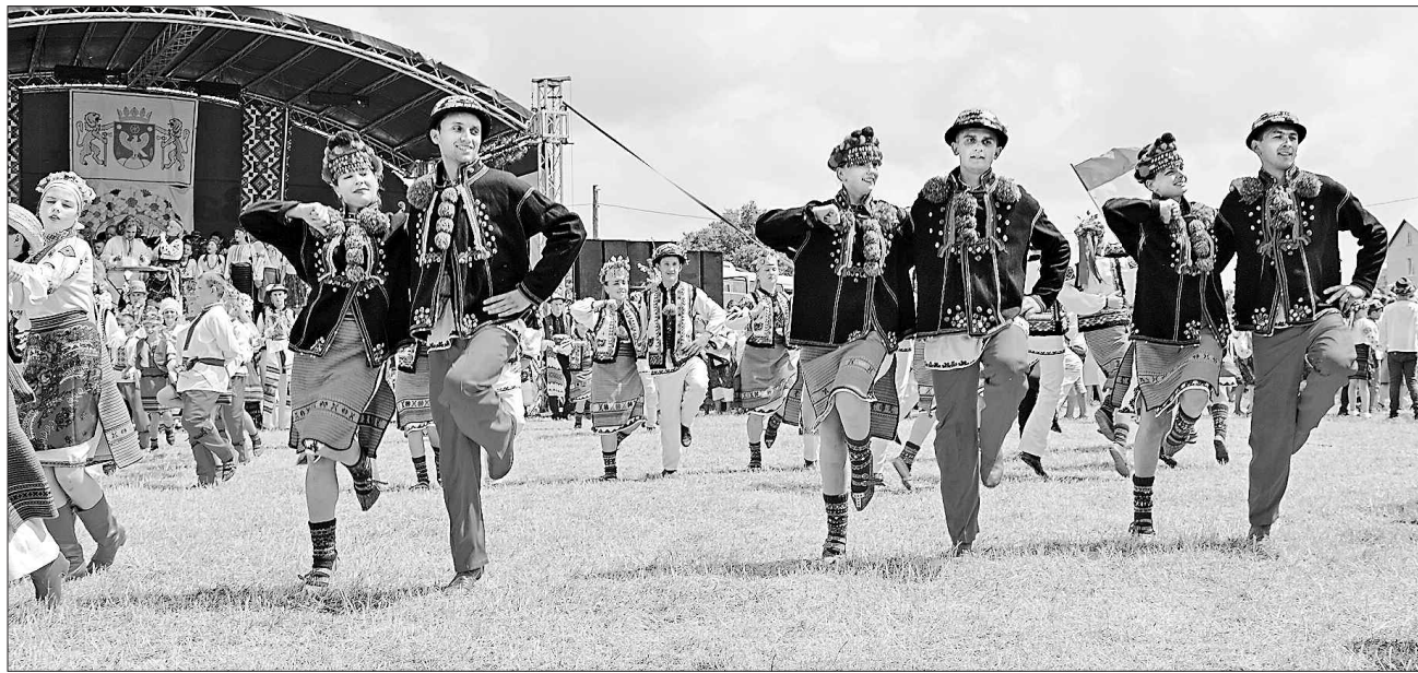
Найрізноманітніші коломийки на добробут і процвітання виконали численні учасники фестивалю

НАРОДНЕ МИСТЕЦТВО. На Покутті відбувся найколіоритніший фольклорно-етнографічний фестиваль