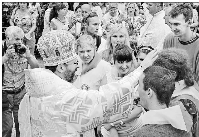
Блаженніший Святослав (Шевчук) благословляє прочан з особливими потребами

Останнім часом хтось активно хоче розсварити українців і поляків. В історії наших народів склалися різні обставини, серед них і трагічні. І поляки, й українці, на жаль, мають за що одне одного перепрошувати. Але минулим повинні займатися історики, а не політики, нам же нині не слід повторювати помилок предків. Бо ж до Бога не наблизимося без покавання, примирення. Тож такі тези звучали й на прощі в Зарваниці. Серед почесних гостей був і голова конференції єпископату Польщі архієпископ Станіслав Гондецькі, митрополит Познанський. Він разом із Блаженнішим Святославом закликав народи Польщі та України до примирення.