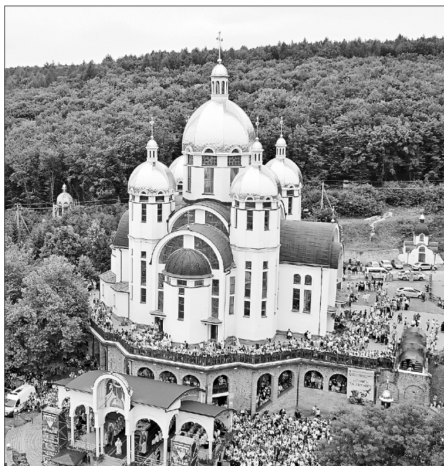
Зарваниця приймає прочан

Із вірянами щиро молилися глава Української греко-католицької церкви Блаженніший Святослав (Шевчук). Він особливо подякував за присутність двом «унікальним групам». Перша — прочани з особливими потребами, «ті, які, можливо, не вті-