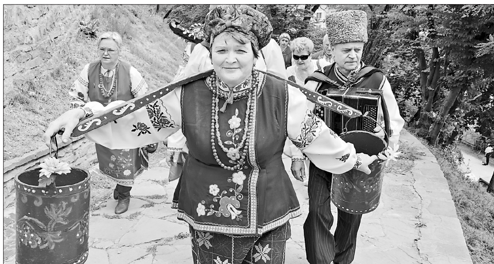
На Замкову гору — з повними відрами фестивального настрою