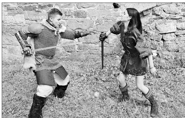
У «Збаразькому гарнізоні» не лише чоловіки

фічний ансамбль «Радість» з міста Очаків, що на Миколаївщині. А відкрила велику концертну фестивалю програму відома ось уже понад півстоліття Струсівська заслужена капела бандуристів України «Кобзар».