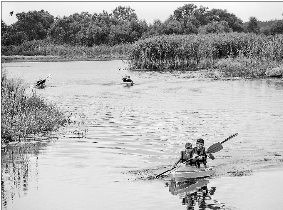
Змагання серед незайманої природи — одна з фішок регати

Прикро, що «Поліська регата» немає сталого фінансування. Тож доводиться організаторам фестивалю йти з простягнутою рукою — шукати спонсорів. А по-державницькому і мудро було б на проведення і популяризацію таких заходів надавати кошти. Тоді й видатки на боротьбу з наркоманією чи курінням зменшилися б.