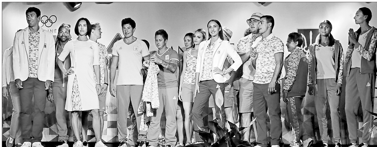
Костюмчик важливий для Ріо — доведено літературними героями

ДО ДРІБНИЦЬ. У столиці презентували нову олімпійську форму української збірної