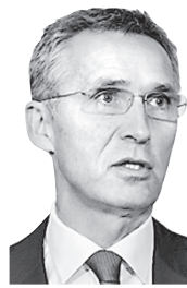
Генсек НАТО про фундаментальний принцип, за яким кожна країна має право обирати власний шлях

ЄНС СТОЛТЕНБЕРГ: «Якщо Грузія чи Україна, чи будь-яка інша держава захоче бути членом НАТО, це вирішувати їм та 28 союзникам, і ніхто більше не має на це права».