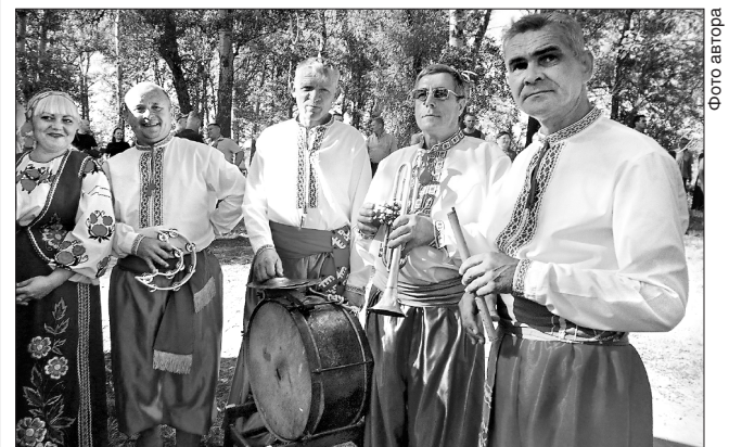
Музика завжди була добрим учителем і агітатором