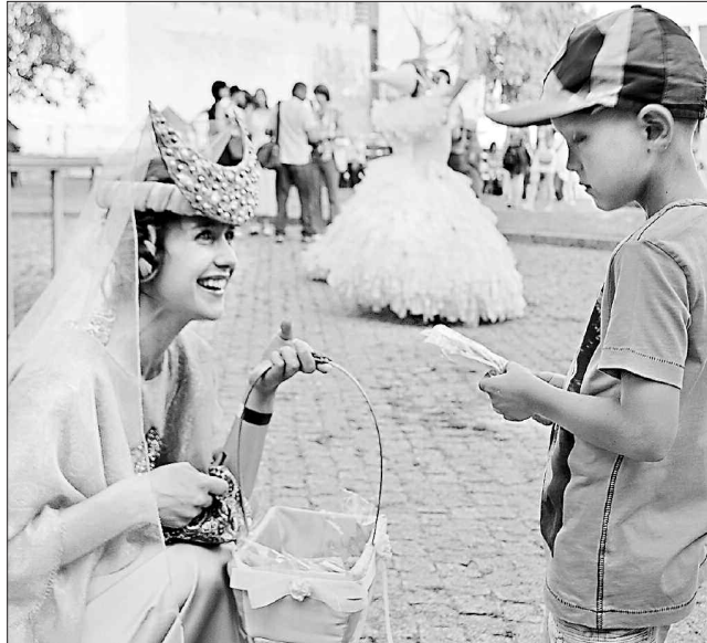
А феї таки існують!

Ніч була багата на сюрпризи для відвідувачів замку. Гостей розважали артисти на ходулях, барабанщики