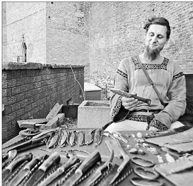
Середньовічних лицарських знарядь було, як кажуть, до кольору, до вибору