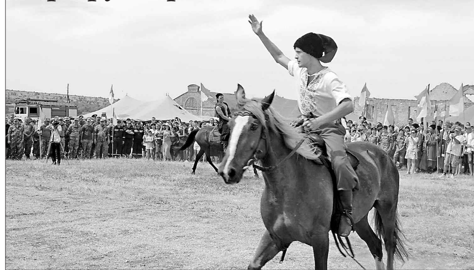
Артисти фольклорно-етнографічного кінного театру сприятимуть залученню туристів