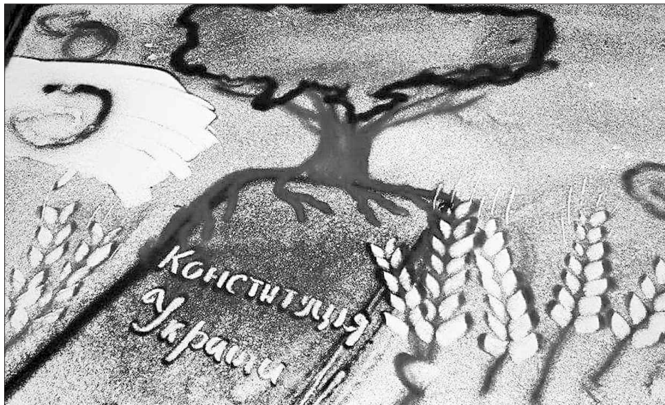
Хотілося б із граніту, та поки що із піску

Несподіваний вихор емоцій бурхливого танцю в другій частині Allegro molto Шостаковича та поява нових пісочних образів — книги й державних символів України — знаменували народження Конституції України. «Таким чином наш народ,