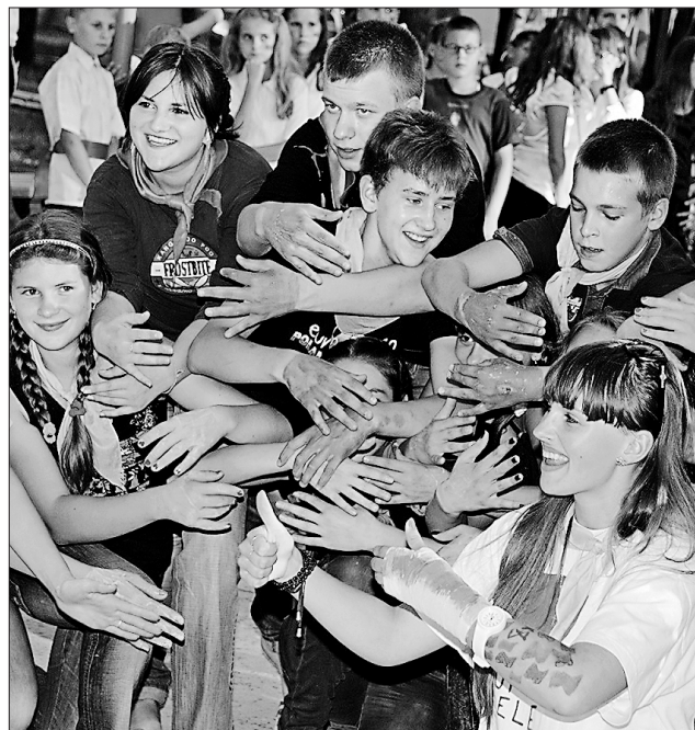
Гарно дітям у «Чайці»!

Передбачається, що протягом літа працюватимуть три оздоровчих зміни: дві наступні відповідно з 5 по 22 липня і з 26 липня по 12 серпня.