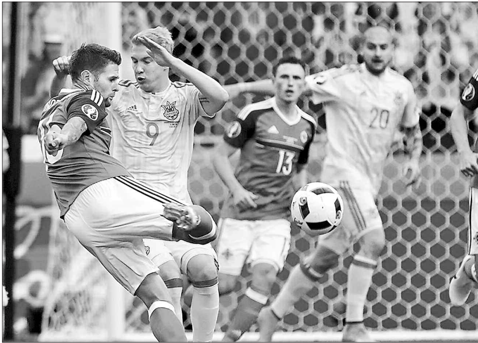
План на гру не спрацював? А яким він був?

Наставник команди також відповів на запитання про справжній рівень збірної України. І не покривив душою. «Тут усе просто: про рівень