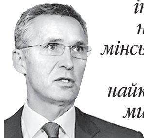
Генеральний секретар НАТО про необхідність якнайшвидшого виконання РФ пунктів цих угод

ЕНС СТОЛТЕНБЕРГ: «Ми не бачимо іншої альтернативи, ніж повне виконання мінських домовленостей, бо це залишається найкращою основою для мирного врегулювання на сході України».