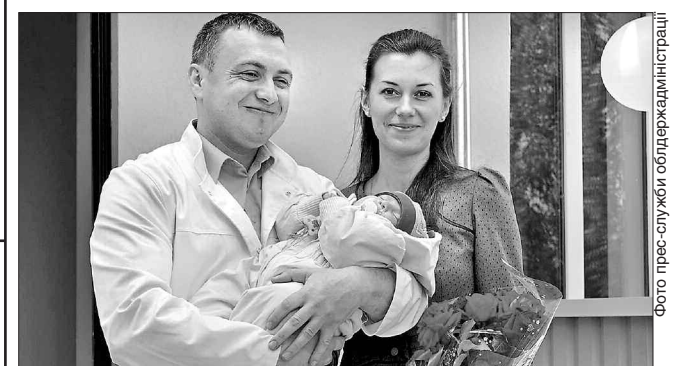
Є чому радіти сім'ї молодих медиків — нова квартира їм до вподоби

Нове благоустроєне житло — результат спільної роботи місцевого керівництва і обласного. Реконструкцію гуртожитку під житловий будинок у Маньківці розпочали ще 5 років тому. Згодом