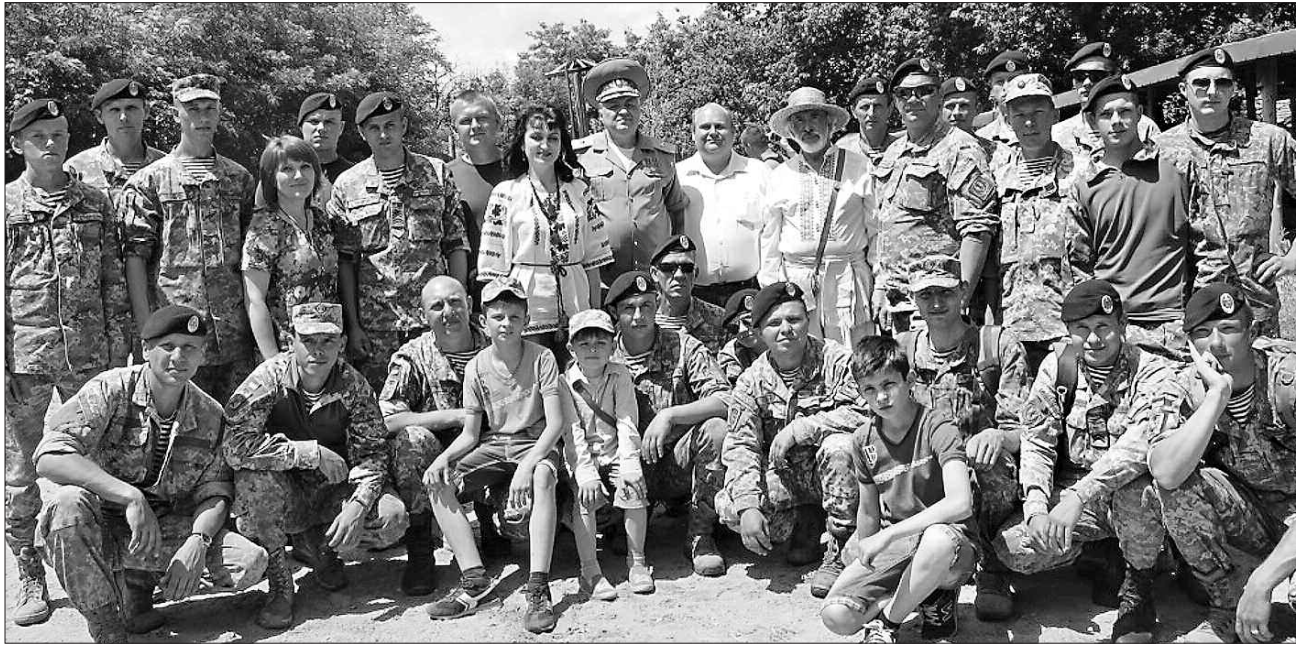
Козацька коліска наснажила не одне покоління українців-воїнів