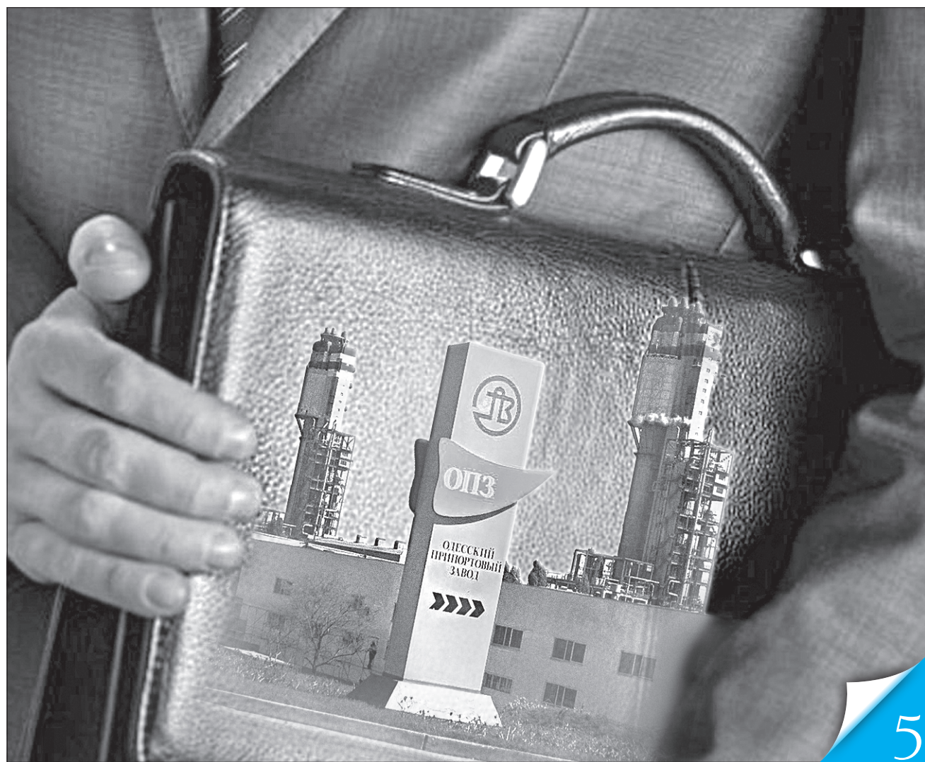
Колаж Ірини НАЗІМОВОЇ