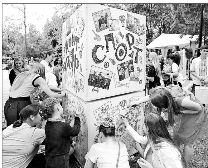
Інсталяція закликає перехожих звернути увагу на профілактику діабету