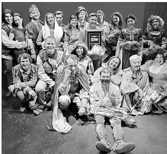
Мить триумфу: Гран-прі!

Існував добродій Вільям насправді, чи це є красива легенда, та поименовані ним вистави — шедеври світової драматургії. Втім, щоб втілити ті твори на сцені, всі, хто за це береться, повинні мати особливий хист. І він, безпе-