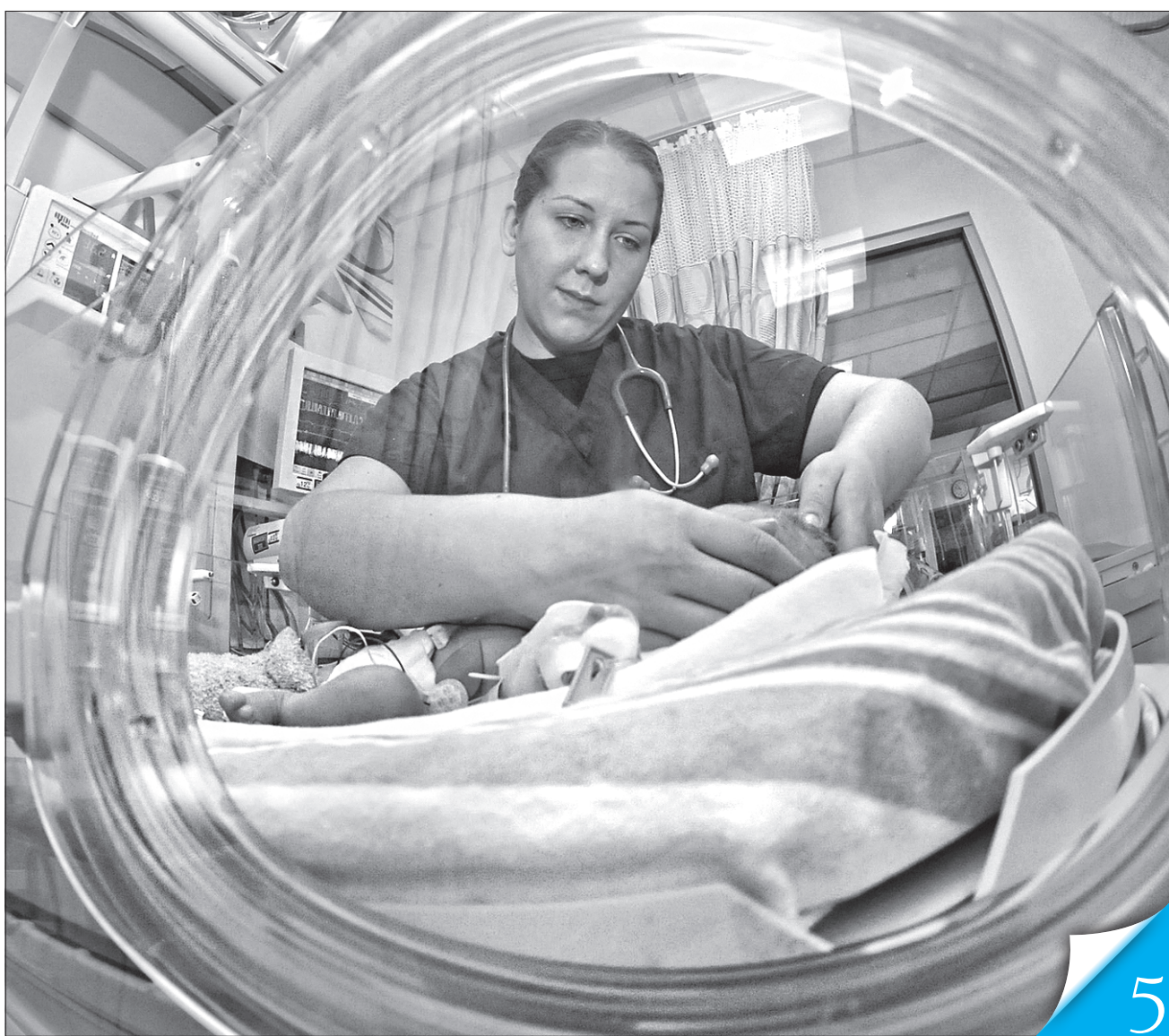
Одна з причин закритих відділень — питання прозорості їхньої роботи

НАБОЛІЛЕ. Не кожен знає, як нестерпно батькам не мати змоги бути поряд з дитиною, коли вона балансує між життям і смертю