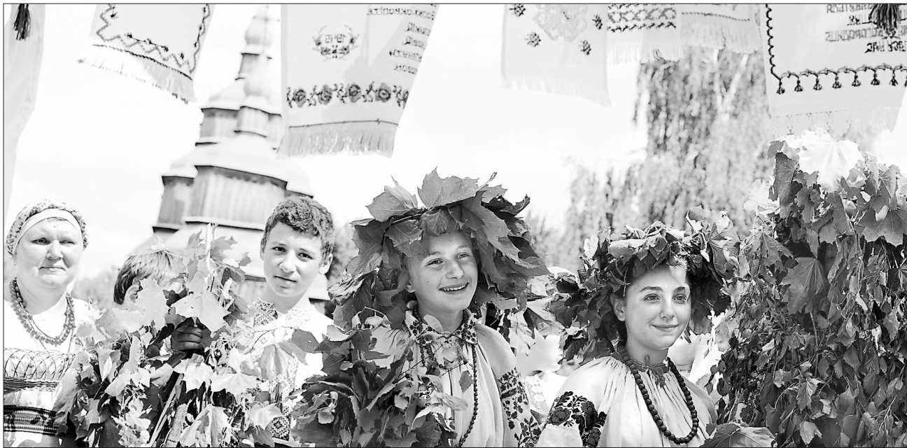
Павло ЛАРІОНОВ для «Урядового кур'єра»

НАРОДНІ ПРИКМЕТИ. Якщо на Вознесіння Господнє день погожий і сонячний — літо буде щедрим