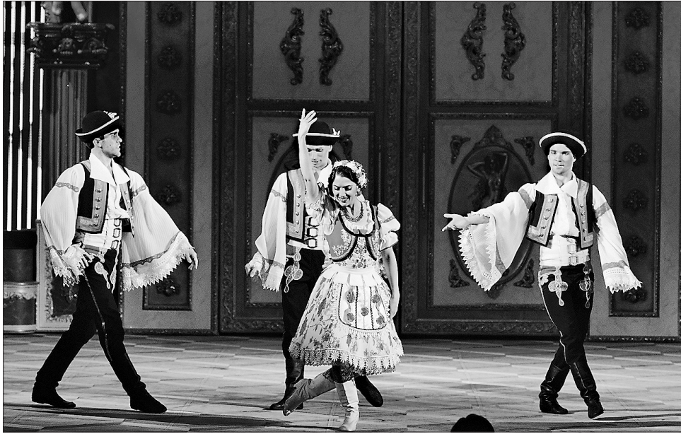
Тріумф хорошої угорської музики на київських хвилях

Укотре вразив народний артист України Святослав Литвиненко, який виступив і як один з безпосередніх учасників дійства (усього у концерті було задіяно п'ятеро диригентів), і як диригент-постановник. Ось Святослав Іванович, якому цього року виповнилося 74, задумливо, тихенько, наче крадучись, іде до диригентського пульта.