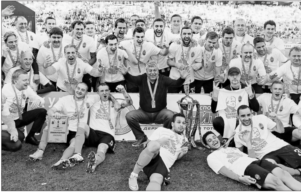
Луческу прищепив футболістам «Шахтаря» психологію переможців

Сам фінальний матч на «Арені Львів», яким офіційно завершувався фут-