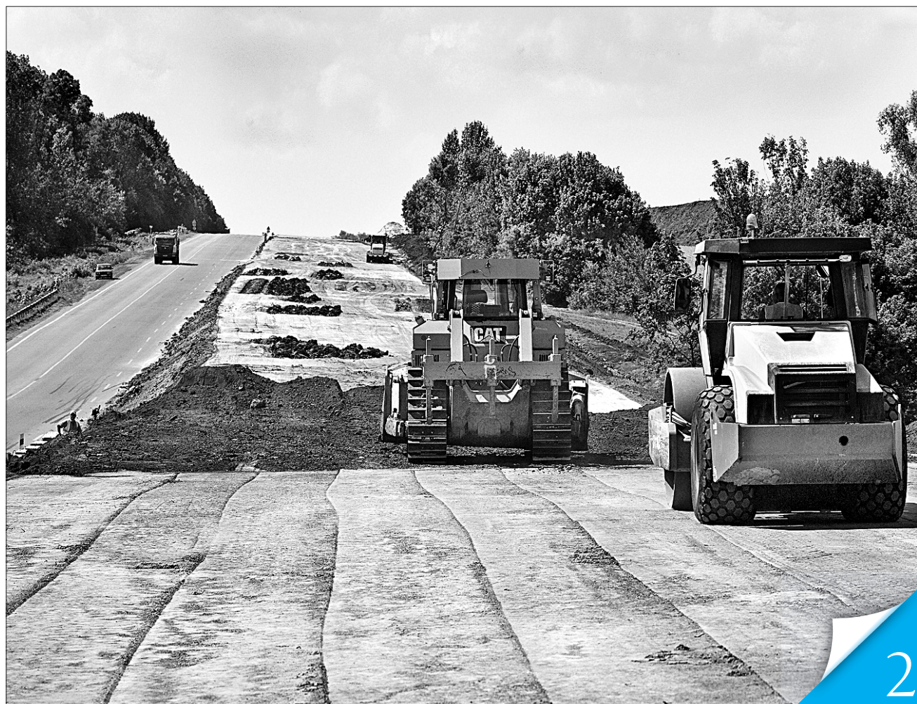
Торувати шлях до успіху — спільне завдання влади і громадянського суспільства

ЗМІНА УСТРОЮ. Прем'єр представив план пріоритетних кроків уряду на поточний рік