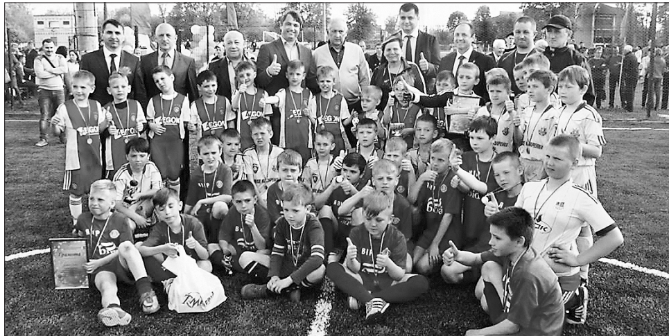
У турнірі-відкритті перемогли юні футболісти з Липової Долини, а місцевим дісталось «срібло»