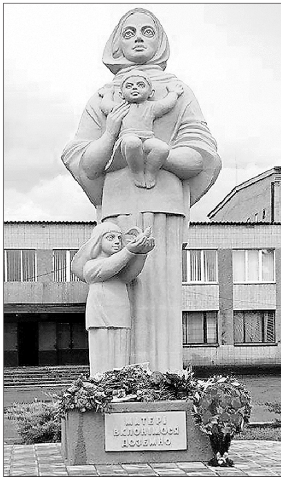
В очах монумента Матері, відкритого в Чапаєвці, — тривога за дітей і віра в Україну

У переліку матерів, які щодня здійснюють подвиг, виховуючи майбутнє покоління, й 23 Матері-героїні з Черкащини, яких цими днями додав до вже відомих указ Президента України Петра Порошенка. Цим документом почесне звання «Матері-героїні» присвоєно 1085 українським жінкам з різних областей.