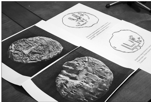
Такий вигляд мав «особистий підпис» київського князя Святослава, на схемі чітко видно двозуб, який згодом став державним тризубом

Про це на презентації знахідки повідомив народний депутат України Андрій Білецький. Він не розповів історії повернення археологічного раритету в Україну, пообіцявши повідомити деталі на презентації артефакту широкій аудиторії приблизно за місяць.