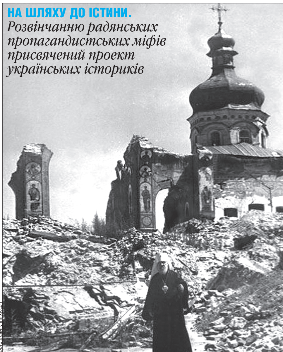
Це все, що залишилося від Успенського собору, який підірвали радянські військові, коли залишали Київ у 1941 році

НА ШЛЯХУ ДО ІСТИНИ. Розвінчання радянських пропагандистських міфів присвячений проект українських істориків