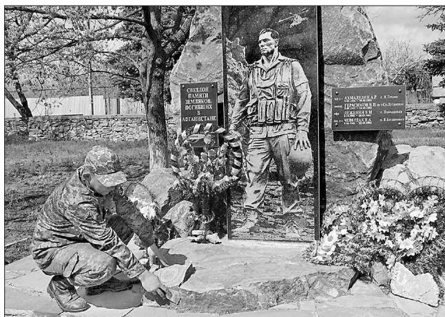
Військовослужбовці завершують передсвяткове прибирання

співробітництва ОТУ «Луганськ», у прифронтових селищах військові візьмуть участь у різних патріотичних заходах: виступлять перед дітьми на уроках мужності у школах, організують роботу польових кухонь для людей похилого віку і відвідують із подарунками ветеранські сім'ї.