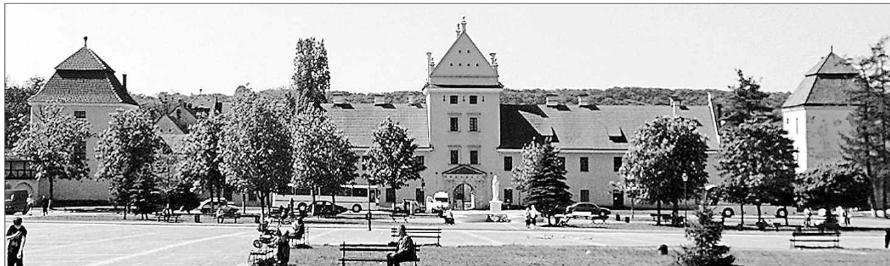
У Жовкві старовинний замок знову приймає туристів

НА МАПІ УКРАЇНИ. За допомогою Євросоюзу відремонтували історичну пам'ятку і туристичний об'єкт