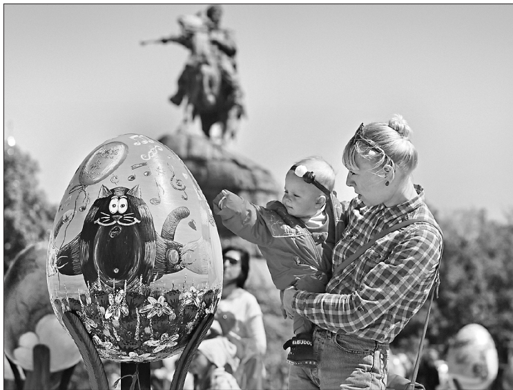
Кияни з великим задоволенням розглядали виставлені біля Софії писанки та обирали найкращі

Фестиваль писанок проходить у Києві вшосте. Художні роботи можна оглянути до 9 травня. А потім писанки помандрують до інших міст України, а також до Грузії, Польщі, Німеччини, щоб іноземці могли долучитися до української народної традиції. Найкращу писанку організатори планують подарувати Папі Римському.