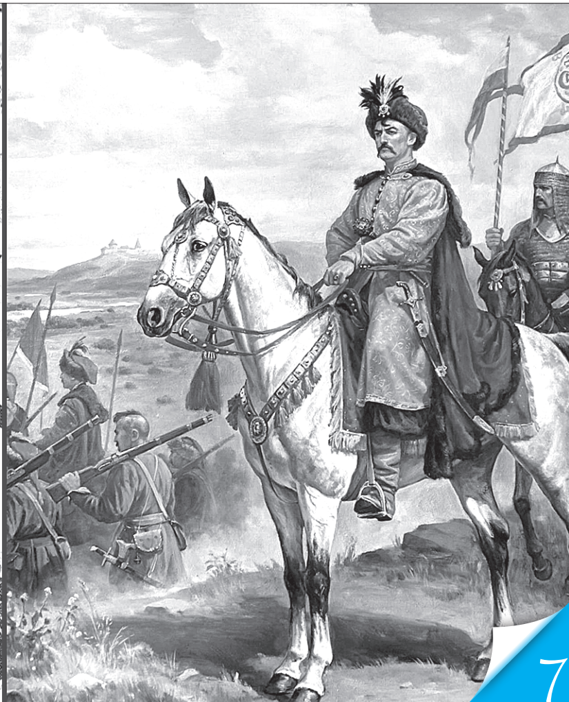
Загалом союз Богдана Хмельницького з Ісламом Гіреєм, як і їхніх попередників та наступників, демонстрував конструктивні політичні відносини двох народів

ЕКСКЛЮЗИВ. Вітчизняні й зарубіжні науковці, спираючись на архівні джерела, розвінчують московський міф про неукраїнськість півострова