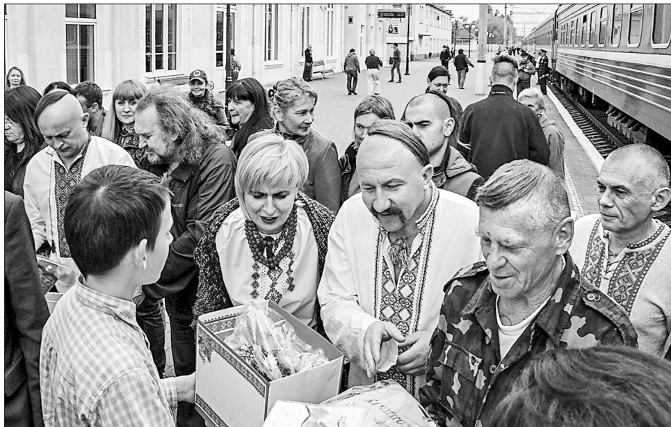
Дорогою активісти збирали просвітницькі подарунки для жителів Донеччини

ЗЕЛЕНИЙ СЕМАФОР. Учора Всеукраїнська культурологічна ініціатива «Потяг Єднання України...» працювала у Слов'янську на Донеччині.