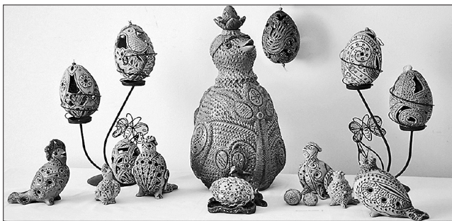
Керамічні різьблені писанки і пташки — візитівка майстрині

Символи трипільської культури, давні знаки подільського писанкарства, традиційна українська символіка, вирізані в її керамічних роботах, створюють особливий мережаний світ.