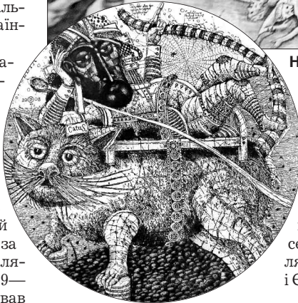
Найзначнішим експонатом стала автентична гравюра Пітера ван дер Хейдена Іга, що в перекладі з латини означає «гнів»