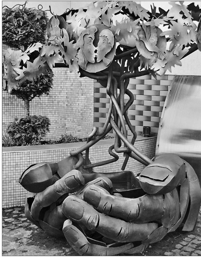
Різні стилі і напрямки сучасного ковальства добре уживаються на одній мистецькій території

Рівняни й справді достойні цінителі металевої краси. Фестиваль «Металеве серце України» вже вчетверте збирав ковалів у центральному парку Рівного. Просто-таки на очах глядачів вони підкорювали, здавалося б, непокірний метал. Спільні роботи авторів цього натхненного любов'ю та добром фестивалю прикрашають один із центральних районів міста. Тут, на алеї кованих скульптур, є й велике металеве серце, і Даринка, що стала символом Рівного, і велика дитяча іграшка, й тритонна фігура «Життєві цінності». Серед них — роботи відомого на весь світ коваля з Голландії Хууба Сенсена, доброго й щирого друга рівнян, який провів тут уже не один майстер-клас. Попереду — п'ятий фестиваль, що відбудеться наприкінці серпня.