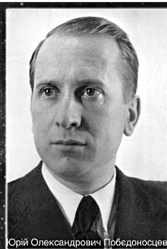
Орій Олександрович Победоносцев