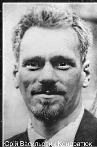
Орій Васильович Кондратюк