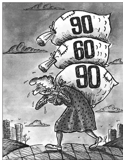
2-га премія: Вадим Симиного (м. Херсон)