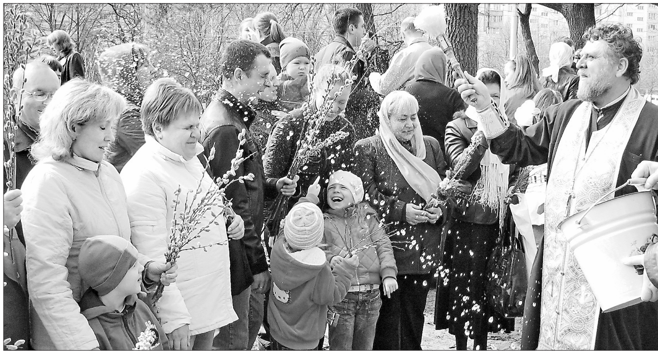
Павло ЛАРІОНОВ для «Урядового кур'єра»

ТРАДИЦІЇ. На нашій землі Вербна неділя здавна була днем масового саджання дерев