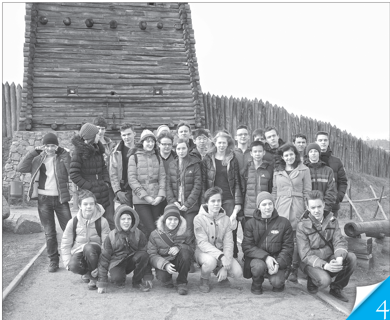
У Запоріжжі учасники Всеукраїнської учнівської олімпіади з математики не лише розв'язували задачі, а й відвідували історичні місця