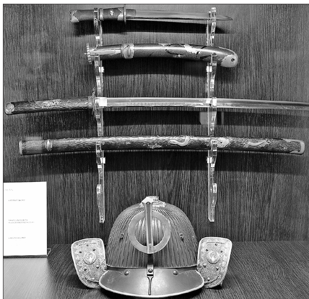
Багато спільного у зброї найкращих воїнів можна побачити навіть неозброєним оком

Українські самураї чи японські козаки? Козацька шабля чи самурайський меч? Нова виставка Міжнародного благодійного фонду, що має назву