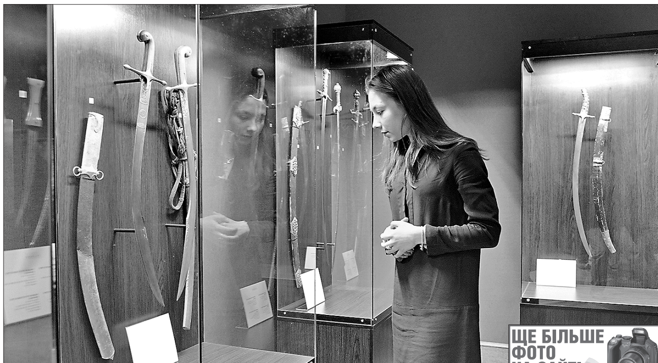
Ганна РОМАШКО для «Урядового кур'єра» Володимир ЗАЙКА (фото), «Урядовий кур'єр»

ІСТОРІЯ ВЧИТЬ. Що спільного між українцями та японцями? Спільні слова. Спільні предки українців-свірян і японських самураїв — сармати суварі. Енергія кі у японців — життєва енергія людини. І наші слова, які містять ту саму частинку кі. Ці слова — доказ того, що й у нас колись було слово на позначення життєвої енергії. Можливо, так її іменували козаки-характерники, припускають сходознавці.