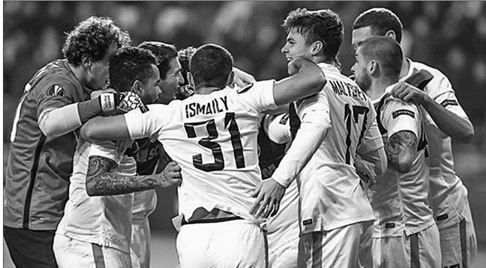
«Гірники» здобули заслужену перемогу

Бельгійцям потрібно було забивати, тож з перших хвилин другого тайму вони активізувалися. Біля воріт Андрія П'ятова виникло кілька небезпечних моментів. Було дуже багато боротьби, господарі часто діяли грубо. Гравці