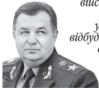
Міністр оборони про терміни повернення додому призваних у шосту хвилю мобілізації

СТЕПАН ПОЛТОРАК: «Демобілізація військовослужбовців, призваних торік у лютому-березні, відбудеться, відповідно до закону, це буде кінець березня — початок квітня цього року».