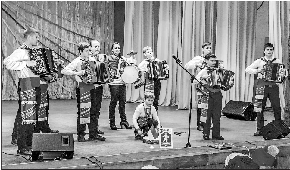
Ансамбль гармоністів на сцені — гра юних музикантів нікого не залишає байдужим

На основі свого практичного досвіду Іван Сухий створив навчальний посібник «Українська гармоніка», який стане у пригоді й початківцям, і досвідченим музикантам. Посібником