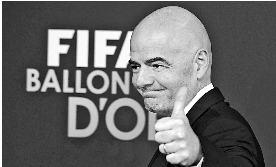
Джанні Інфантино переміг свого головного конкурента шейха Салмана бін Ібрагім аль-Халіфа з рахунком 115:88

Ще одним важливим рішенням конгресу стало скорочення кількості комітетів ФІФА з